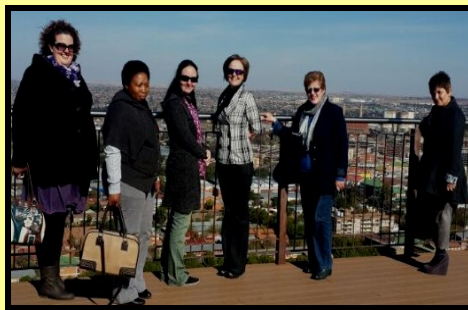
Aurora Centre's staff on Naval Hill to celebrate social workers' day (with the permission of the director) followed with a brief visit to a spa.