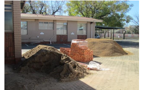
Boumateriaal word afgelaai

3, 5 & 8 JULIE 2015: Die kantoor vorder en die Argief (kluis) se fondasie word gegrawe