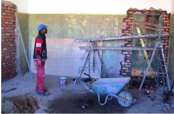
Ou kombuis word in kantoor omskep