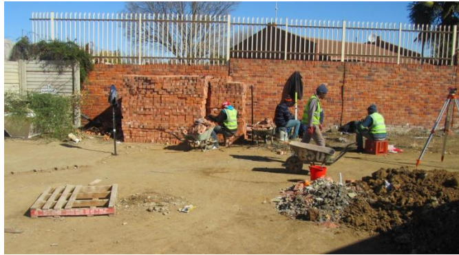
Terrein word voorberei