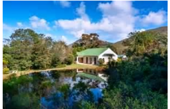
"Volmoed... a place of healing"