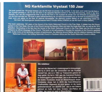
Agerblad van Fotoboek