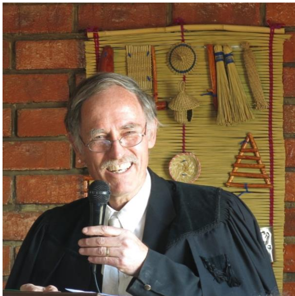
By die inwyding van die NG Kerkgebou op Clooclan, wat hy help bou het.