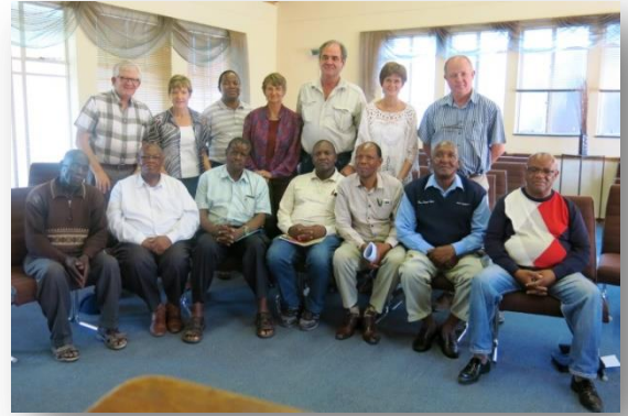
Bo: Samesprekinge tussen die NGK, VGKSA en NGKA gemeentes op Harrismith Onder: Die mooi nuwe kerkgebou van die VGKSA op Tsiamé word eersdaags ingewy

Departement Praktiese- en Missionale Teologie van die Vrystaatse Universiteit. Dr Dawid geniet die tyd daar en hy help ons baie om die verhoudinge steeds verder uit te bou. Hierdie betrokkenheid by die teologiese opleiding van die Reformed Church in Zambia is vir ons kerk van groot belang; dit is wedersyds geweldig verrykend. En ons verhouding met en diepe betrokkenheid by hierdie kerk strek immers so ver terug as 1899, die jaar toe die Boere-oorlog begin het en die eerste twee sendelinge as gestuurdes van die Vrystaatse kerk daar begin werk het.