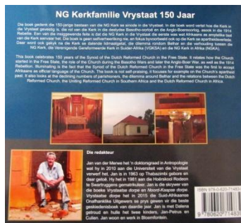
Agerblad van Fotoboek